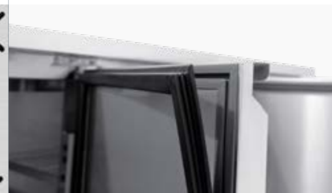
DOOR RESISTANCE Resistenza sulle porte