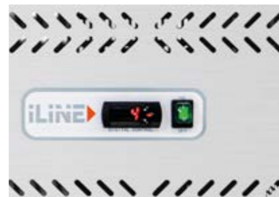
DIGITAL CONTROLLER Centralina elettronica