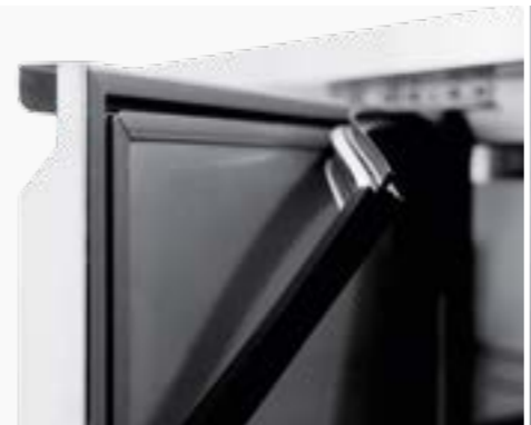
DOOR RESISTANCE Resistenza sulle porte