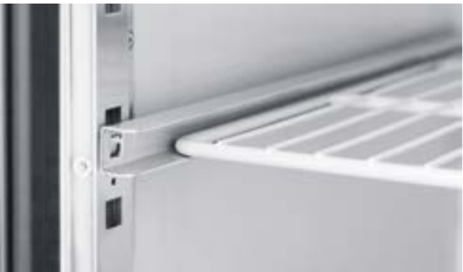
PLASTIFIED GRIDS AND GUIDES IN STAINLESS STEEL Griglie plastificate e guide in acciaio INOX