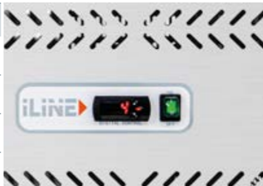
DIGITAL CONTROLLER Centralina elettronica