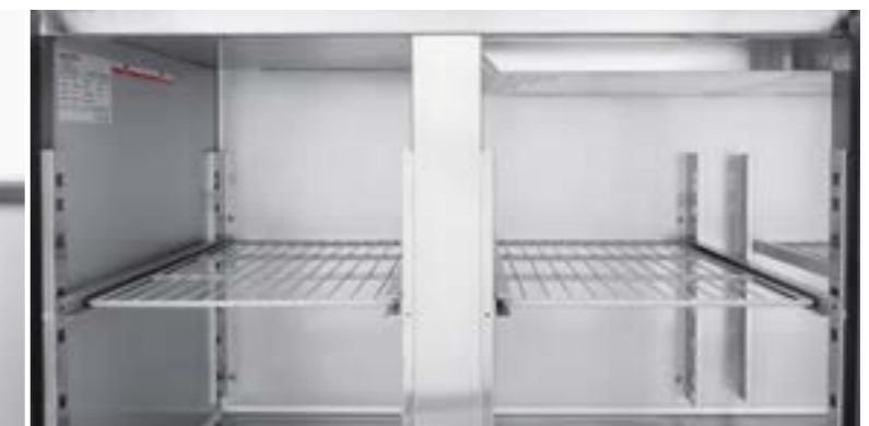
PLASTIFIED GRIDS AND GUIDES IN STAINLESS STEEL Griglie plastificate e guide in acciaio INOX